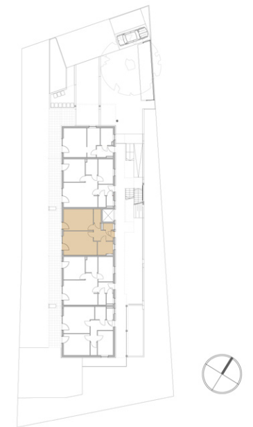
Lage im Objekt