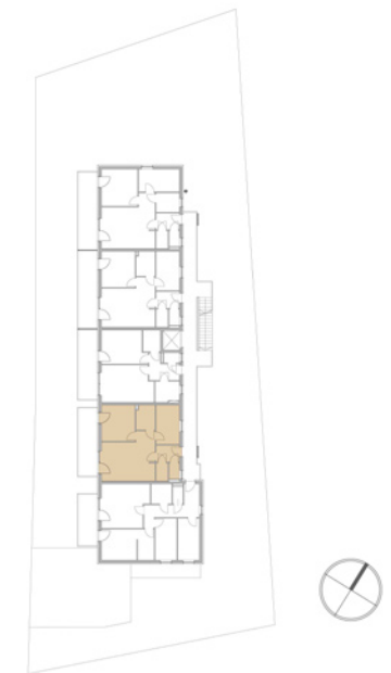
Lage im Objekt